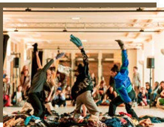
Cie Cactus 14 LES ESSORÉS résidence 08 → 12/04/2024